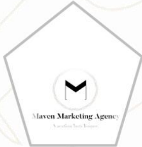
Maven Marketing Agency