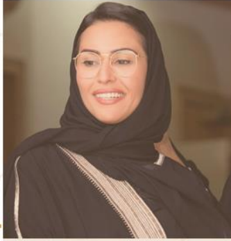
الأميرة سري بنت سعود بن سعد آل سعود نائب مجلس الأمناء