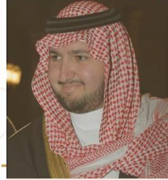
صاحب السمو الملكي الأمير عبدالعزيز بن طلال بن عبدالعزيز رئيس مجلس الأمناء