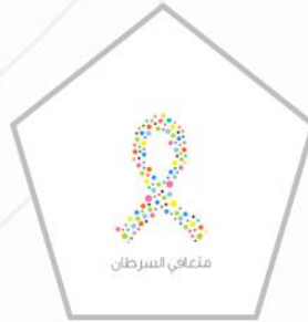
مؤسسة متعاى الوقفية